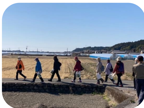
歴史探訪ウォーキング (東部会場 安芸市)