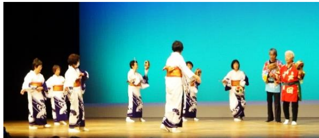
宇佐江島踊保存会（土佐市）