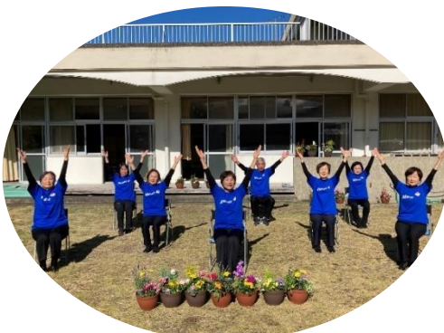
いきいきクラブ体操 スクリーン上映 （室戸市老連）