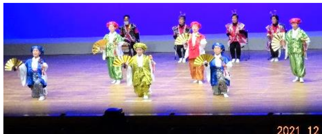
宿毛市老連若手委員