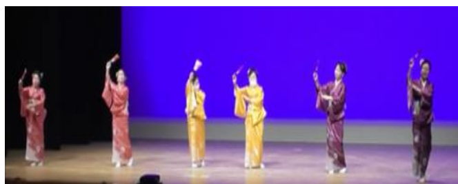
輪の会 吾川支部（仁淀川町）