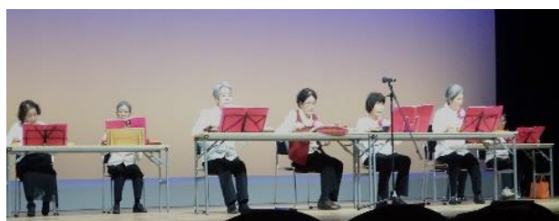
春菊の会 すこやかクラブ（須崎市）