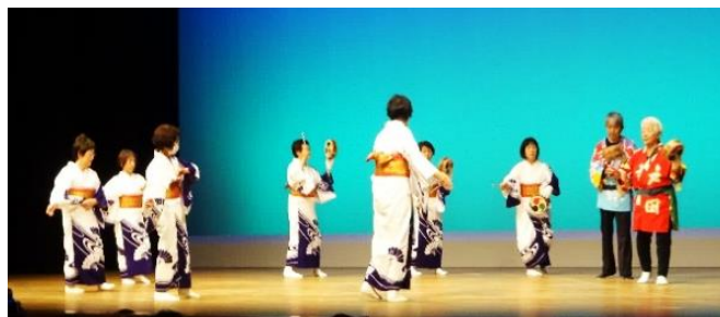
宇佐江島踊保存会（土佐市）