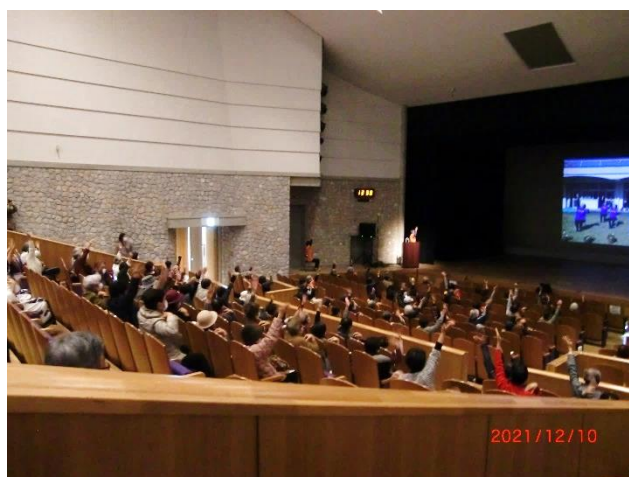
いきいきクラブ体操 スクリーン上映 （室戸市老連）