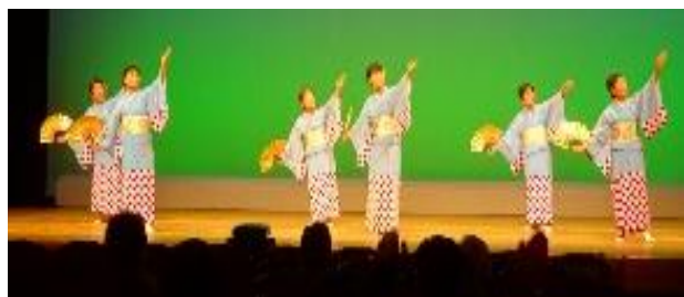
輪の会 上分清流クラブ（須崎市）