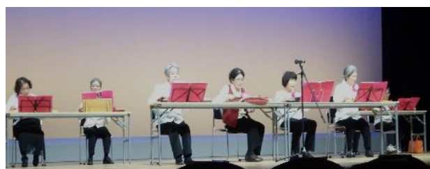
春菊の会 すこやかクラブ（須崎市）