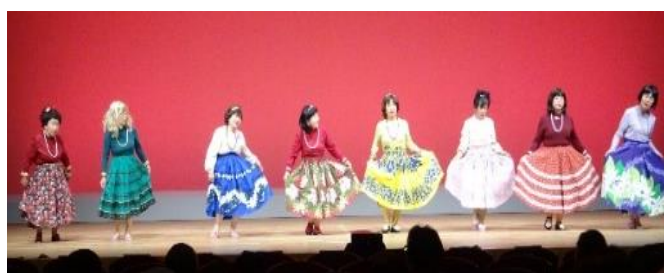
音竹老人クラブ（いの町）