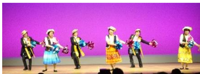
大野見仲良し会（中土佐町）