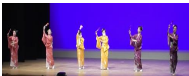
輪の会 吾川支部（仁淀川町）