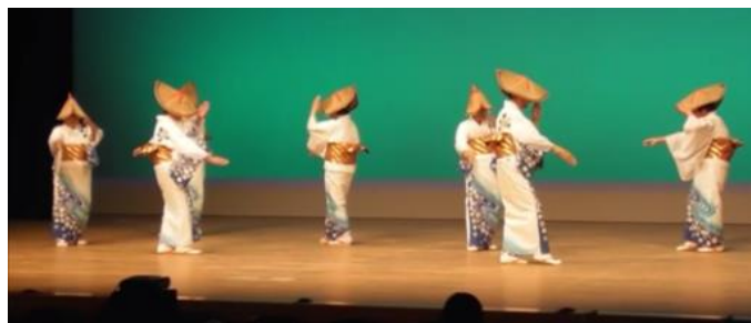
奈半利町民踊愛好会（奈半利町）