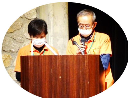
司会（廣瀬女性委員・松岡若手委員）