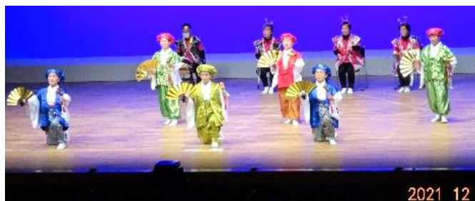
宿毛市老連若手委員