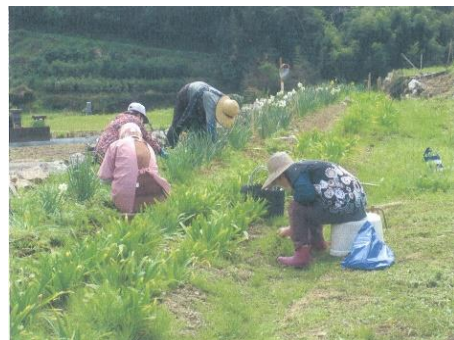
花の手入れ(いの町)