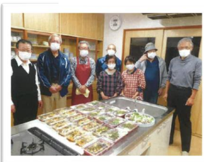
若手会員交流会〈料理教室〉 （津野町）