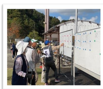
西部会場（ワナゲ、グラウンド・ゴルフ）