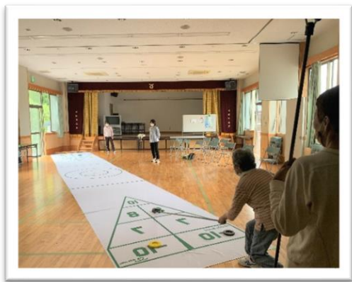
ニュースポーツ交流会（土佐市）