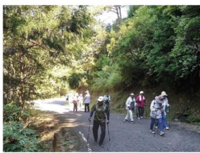
健康ウォーキング（四万十町）