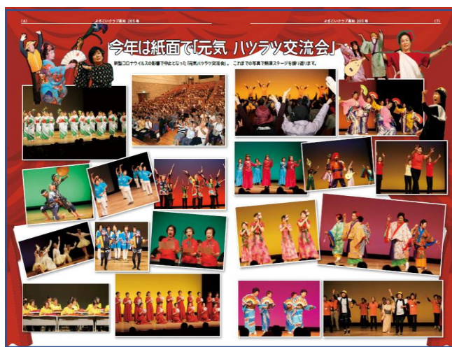
元気ハツラツ&はちきん大会特集記事 （機関紙「よさこいクラブ高知 205 号」）