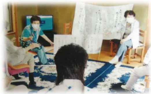
健康づくり活動（いの町）