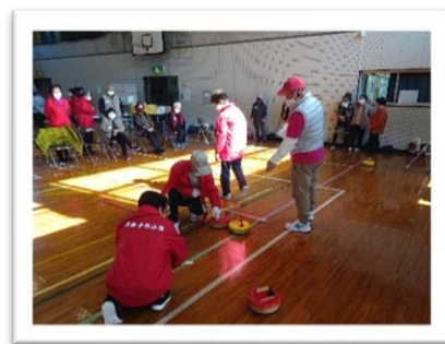
フロッカー大会（宿毛市）