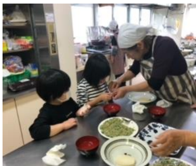
子どもたちとの料理教室(室戸市)