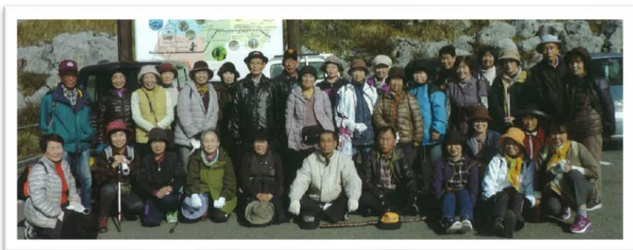
天狗高原ハイキング（土佐市）