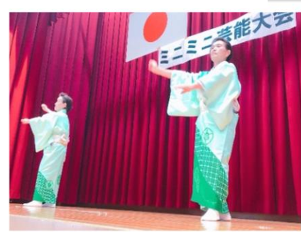
ミニミニ芸能大会（梶原町）