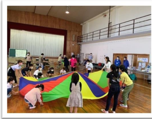
子どもたちとの音楽療法（室戸市）