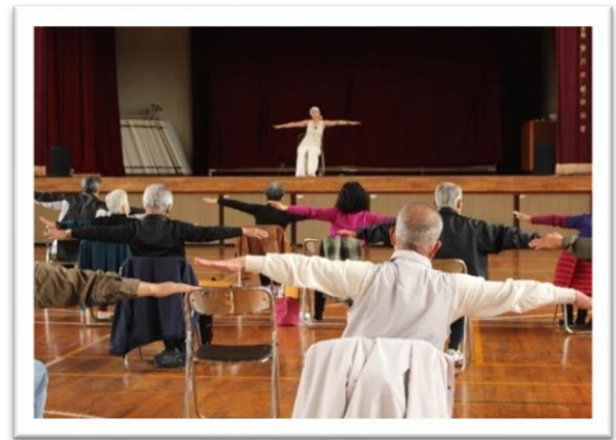
ストレッチ&サルサ（東部会場・室戸市）