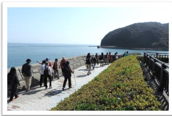
ウォーキング（中部会場・土佐市）