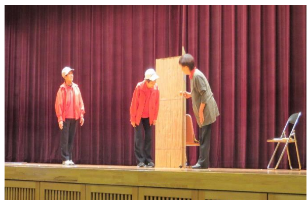
寸劇 (詐欺被害防止)