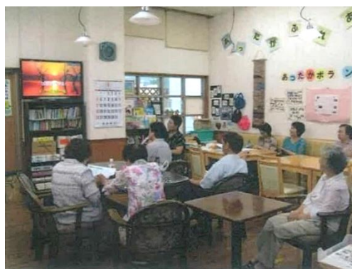
カラオケ教室（いの町）