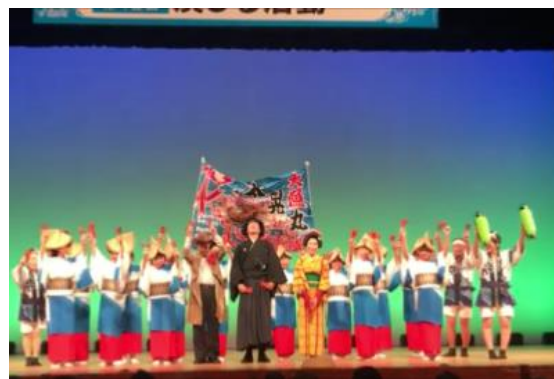
全国老人クラブ大会