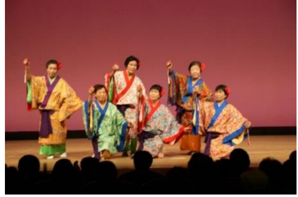
市町村老連の芸能出演