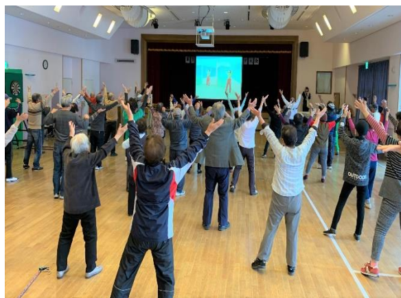
第1回室内スポーツ大会（高知市）