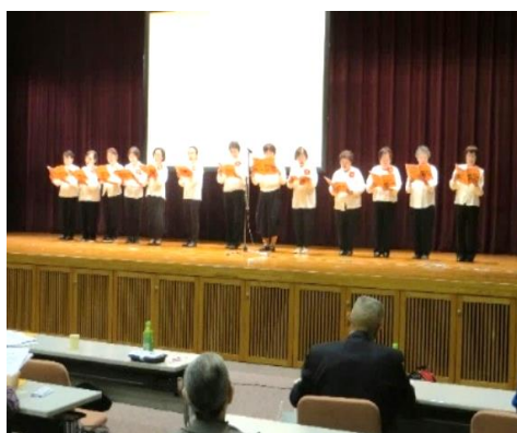
オープニング コーラス