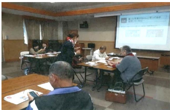
スマートフォン講座（梶原町）