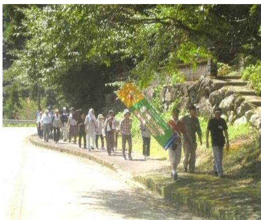
ウォーキング（津野町）