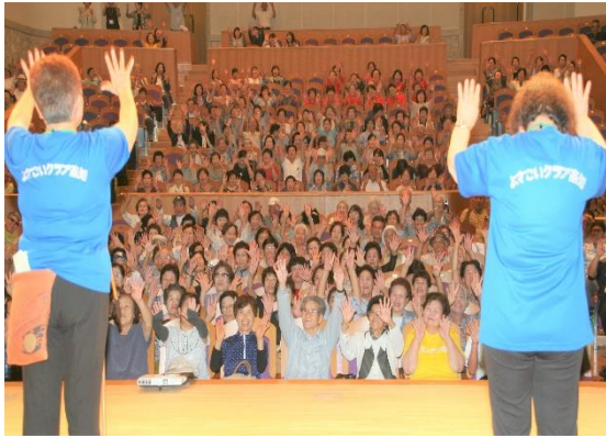
みんなでやってみよう！