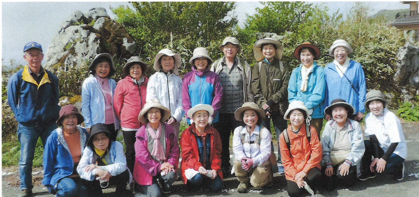
さあ！出発 自由散策コースに参加の皆さん「足の向くまま、気軽にセラピーロードを！」