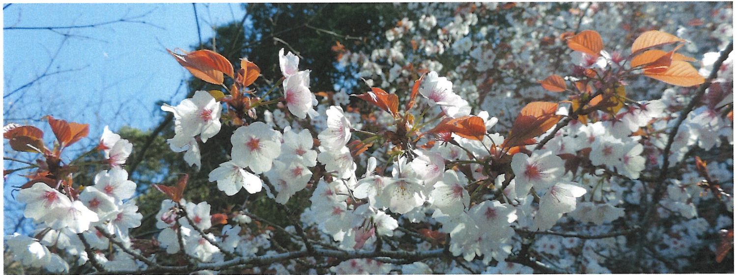
宇佐大橋のたもとでは青龍寺に向かう皆さんを温かく迎えて“桜の花”が満開・・・！