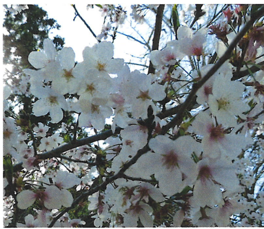
青龍寺へ行く山越えの遍路道に 桜「ソメイヨシノ」が満開