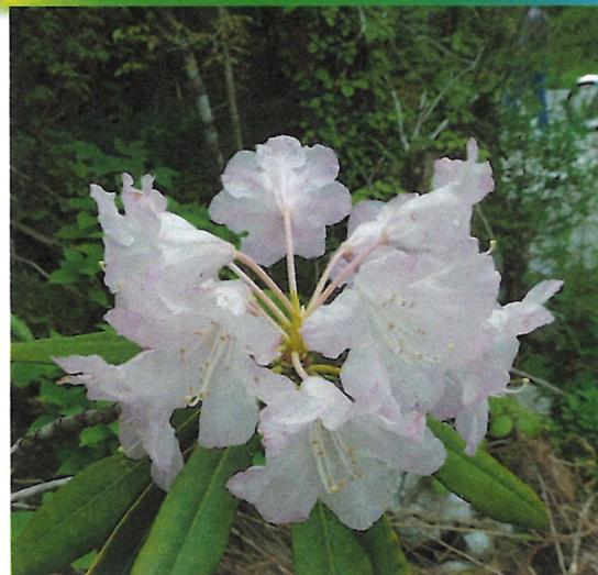
ツツジ科「シャクナゲ」