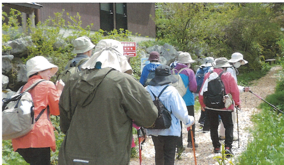
セラピーロード散策コース「ゆっくりと自らの力を信じて！」