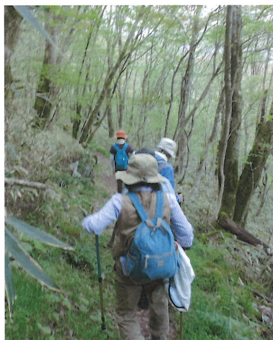
天狗の森コースへ挑んだ皆さん少人数ながらこの時期の山野草を十分満喫！