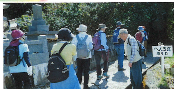
標識もここから“遍路道の入り口”です！