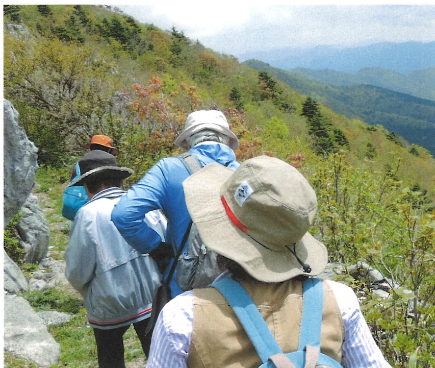
天狗の森への道は、沢山の山野草を楽しみながら！ -4-