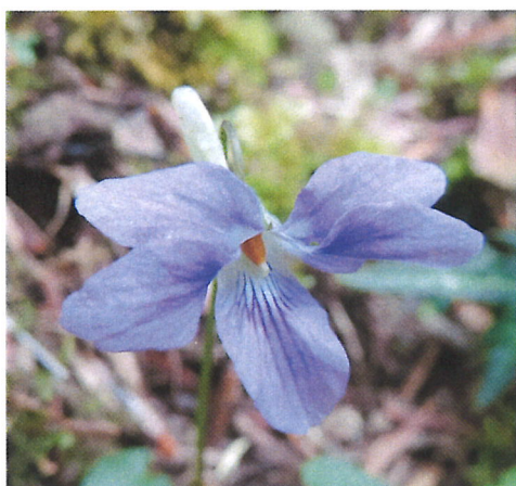
天狗高原 「タチツボスミレ」