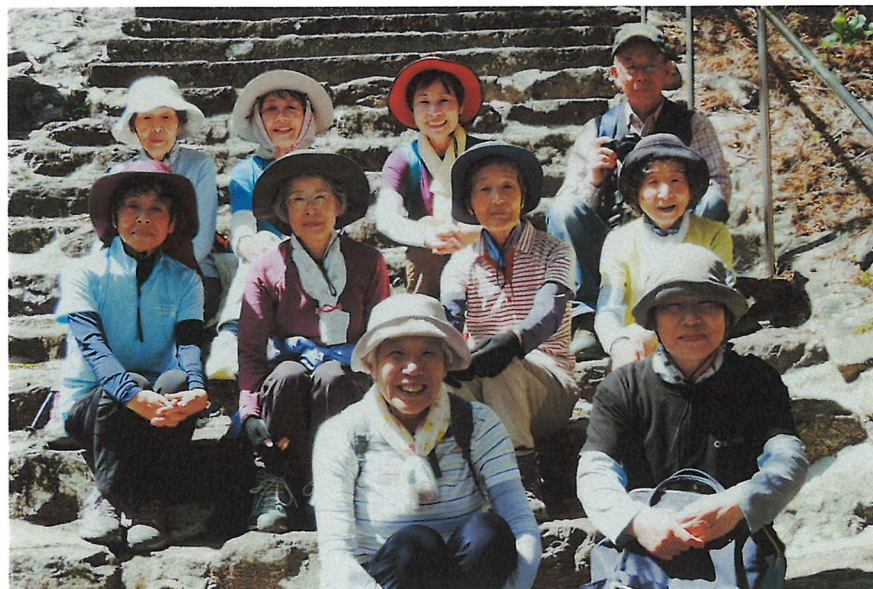
青龍寺を登る階段に腰を下ろして一息を付き！