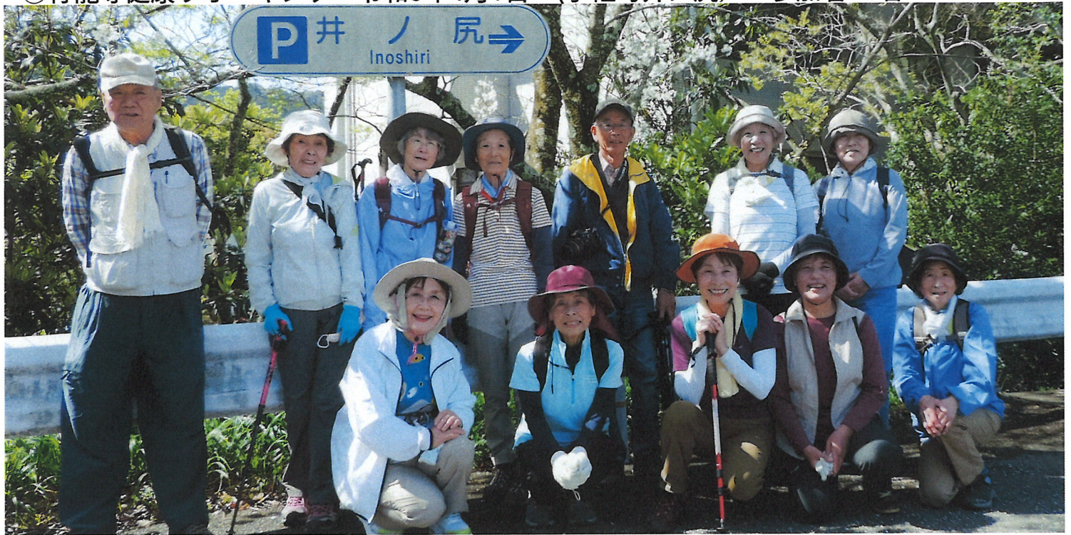
宇佐竜「色見崎駐車場」に集合し、太平洋を眺めながら、井尻峠の遍路道をウォーク！