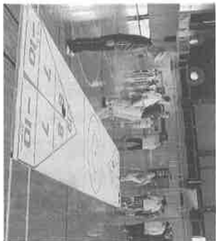
「健康づくりリーダー養成講座」 (中央西会場) のひとこま