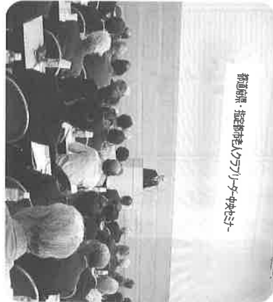
高知県 指定都市のクラブリーダー

また、各県の老人クラブも 大なり小なり、活動内容や会 員減少の悩みは共通しており ます。次世代のリーダーは団 塊の世代によるところが大きく、 我々の時代とは20年以上の差 があり、社会変化の違いも大 きく、かなりの個人技に恵ま れた彼等でありますので、そ こに視点論点を見出すのも一 考だと思えます。