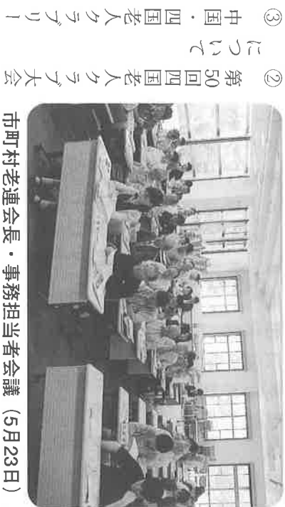
市町村老連会長・事務担当者会議 (5月23日)