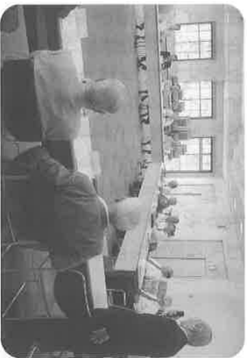
第1回評議員会(6月30日)