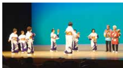
宇佐江島踊保存会（土佐市）