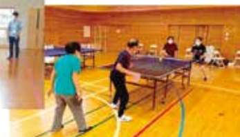
ラージボール卓球