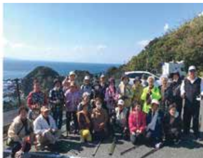
佐多岬で健康ウォーキング♡