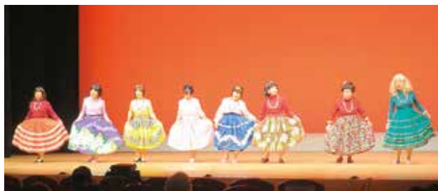
音竹老人クラブ（いの町）