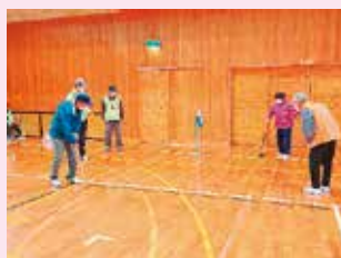
室内グラウンド・ゴルフ (梶原町)