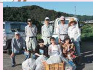
「河川周辺の美化活動」 (土佐市)

内容：花壇・公園などの整備、清掃（歩道、公園、駅、 学校、集会所等）、花壇づくり等