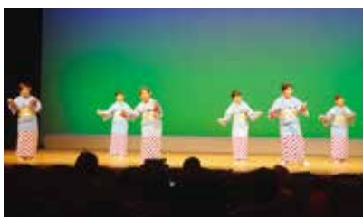
輪の会 上分清流クラブ（須崎市）