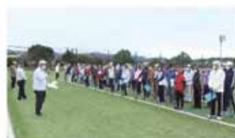
グラウンド・ゴルフ開会式