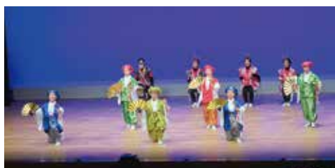
宿毛市老連若手委員