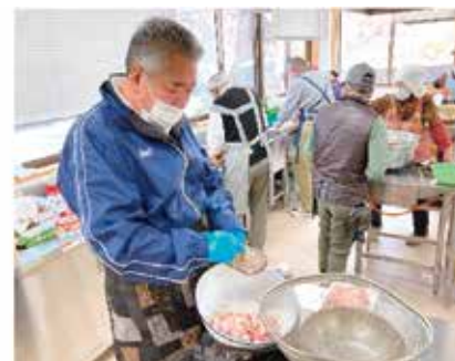
男の料理教室!!慣れたものです♪