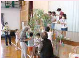
「子どもたちと七夕飾り」羽根寿会 (室戸市)

内容：友愛訪問、通勤通学時の交通安全見守り、 雑巾を保育園等に寄贈、敬老の日のお弁当配達、 世代間交流（七夕飾り、昔遊び、お芋掘り）等