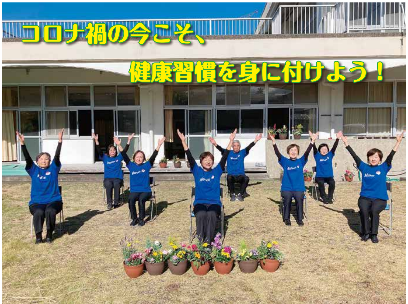
いきいきクラブ体操～お揃いTシャツを作りました！～（室戸市老人クラブ連合会）

発行者：高知県老人クラブ連合会 高知市朝倉戊 375-1 電話 (088) 844-9154 ホームページ： http://www.yosakoiroc.net