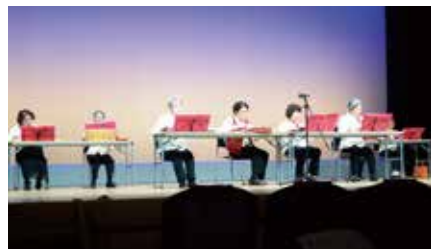
春菊の会 すこやかクラブ（須崎市）