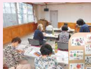
友愛訪問の「絵手紙づくり」 (越知町)

内容：健康ウォーキング、軽スポーツ、百歳体操、ラジオ体操、ミニ運動会、ミニ芸能大会、 グラウンド・ゴルフ大会、友愛訪問の絵手紙づくり、料理教室、健康づくり講座、しめ縄づくり 等