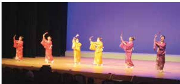
輪の会 吾川支部（仁淀川町）