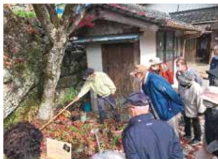
山野草について勉強中 (津野町)

今年度も多くの事業が、コロナの影響を受けました。やむなく中止になった事業もありましたが、感染対策を徹底しながら開催したり、代替事業を行うなどして、少しでも会員が集い楽しめる機会を作っています。