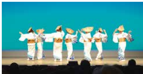
奈半利町民踊愛好会