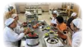
みんなでする料理やおしゃべりをいつも楽しみにしています。

香美市香北町では、単位老人クラブの枠を超えて意欲的な女性会員が集まり、女性部を結成して活動しています。