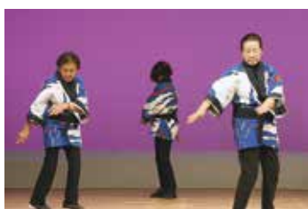
うばざくらの会 (日高村老連)