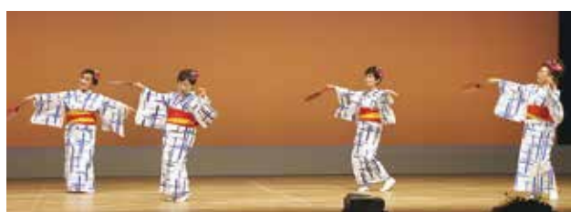
宿毛市老連 若手委員会