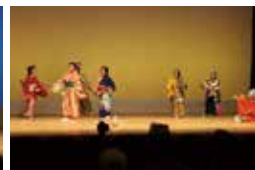
大会で見せた見事な早変わりも、日頃の練習の賜物です。