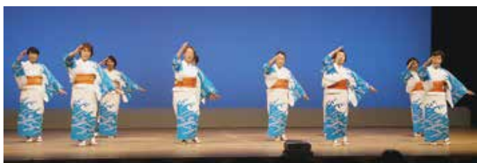
憩民踊 (高知市老連)