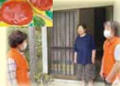
絵手紙友愛訪問（梶原町）