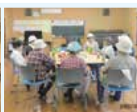
それぞれのクラブでも活動をしています。