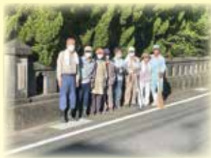
忠魂墓地の清掃（田野町）

室戸市老連 8 クラブ 安芸市老連 16 クラブ 土佐市老連 2 クラブ 田野町老連 5 クラブ 須崎市老連 4 クラブ 梶原町老連 2 クラブ 越知町老連 5 クラブ