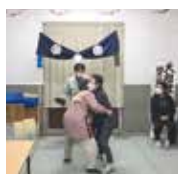
大会に向けた練習風景。本番さながら気合十分です。