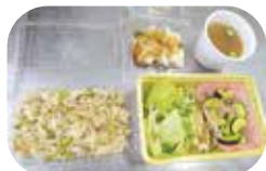
メニュー:枝豆と豚肉の炊き込みごはん、魚の薬味ソースかけ、ズッキーニの炒め物、トマトとオクラのスープ、牛乳わらび餅

香我美町高齢者クラブは、6月28日(火)に、季節の食材を食べて免疫力をアップし、『夏野菜で暑さを乗り切ろう！』というテーマで料理教室を開催しました。コロナ禍で開催が延期延期となっており、やっと実施できました。