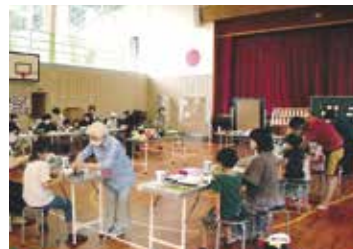
子ども達や会員同士のふれあいでも楽しめました。

両事業とも、参加者から来年も開催して欲しいという声がたくさんあり、事業の運営に携わった会員にとっても、開催した甲斐のある、充実した楽しい時間となりました。