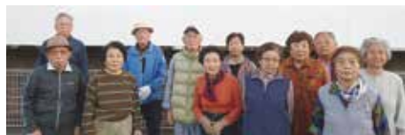
朝の清々しい空気の中で気持ち良く体操をしています。

城山町朗人クラブでは、ずいぶん前より、冬場の寒い時期と日・祝日を除く毎日、朝 6 時 30 分からの NHK のラジオ放送に合わせて、近くの量販店の広場でラジオ体操をしています。