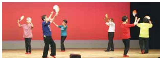
香南市高齢者クラブ 民謡体操教室