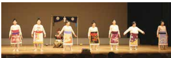
吉野千寿クラブ (香美市老連)