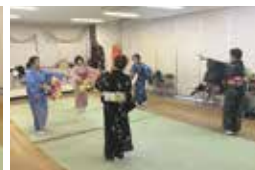
練習は夜 8 時から 2 時間程度。本番が近いと詰めた練習も!