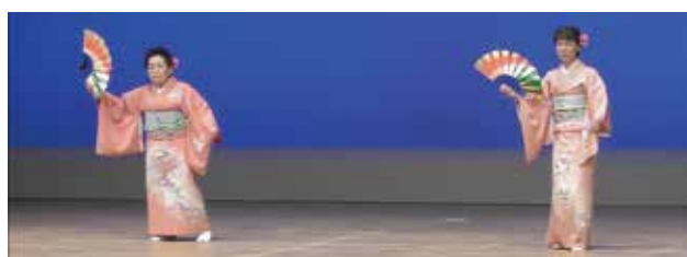
輪の会 初瀬グループ (梶原町)