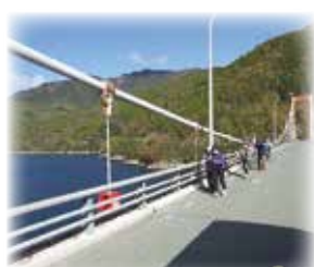
少し風がありましたが、自然の風景を楽しみながら歩きました。