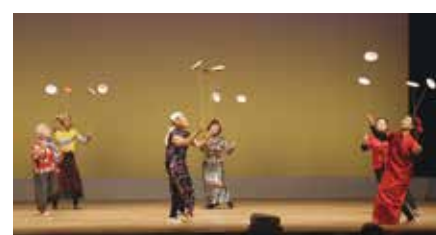
安芸市老人クラブ連合会