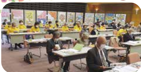
会場には、会員の方々が製作してくださった折り紙作品が並び、華やかさを添えてくれました。