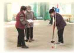
グラウンド・ゴルフ大会（越知町）