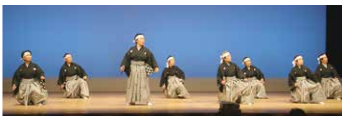
輪の会 北川支部 (津野町老連)