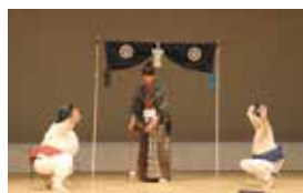
ユーモラスな演技で、会場は笑いの渦に（^o^）