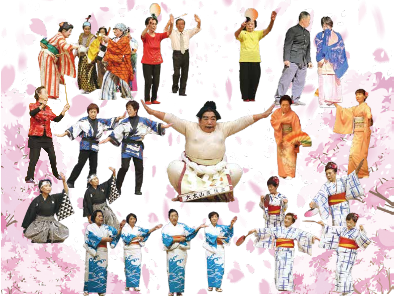
令和4年度元気ハツラツ&はちきん大会