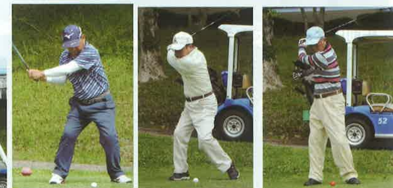
プレーのスタート時に少しお邪魔して、 “ボールを打つ瞬間”をとらえました！ “打つ姿はプロ級並みです”