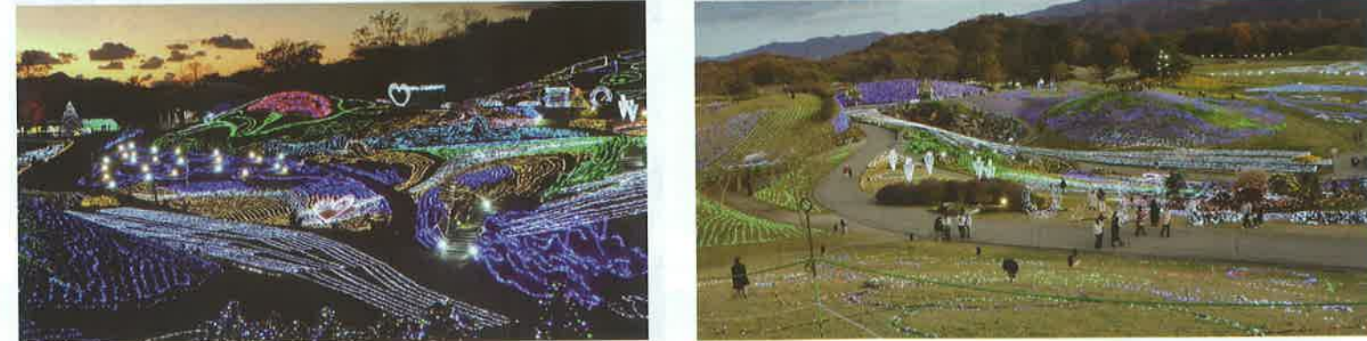
まんのう公園広場で、繰り広げられるイルミネーションを見ながら！”素晴らしい”と感嘆！