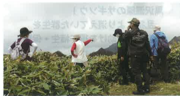
瓶ヶ森「UFOライン」からの眺め！