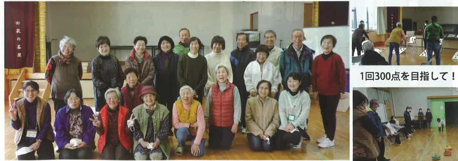
競技会へのエントリー19名の皆さんと事務局 輪投げ”「意外と思うところへ行きません！」