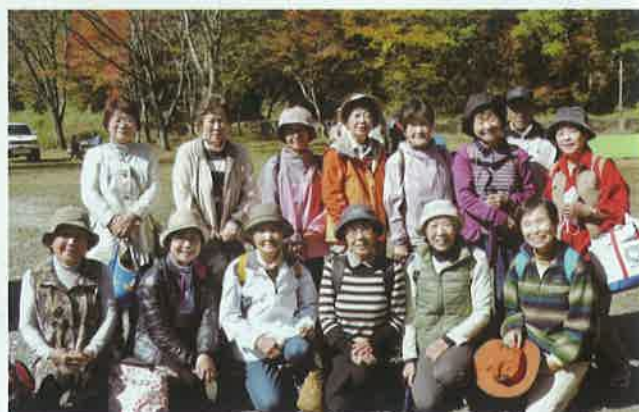
高石地区"大豊町「定福寺&夢来里」研修