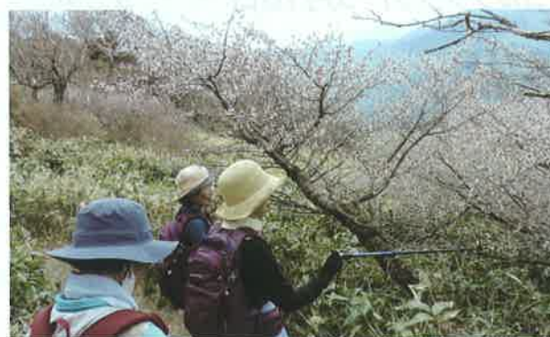
この花の名前は「イシツチザクラ」バラ科！