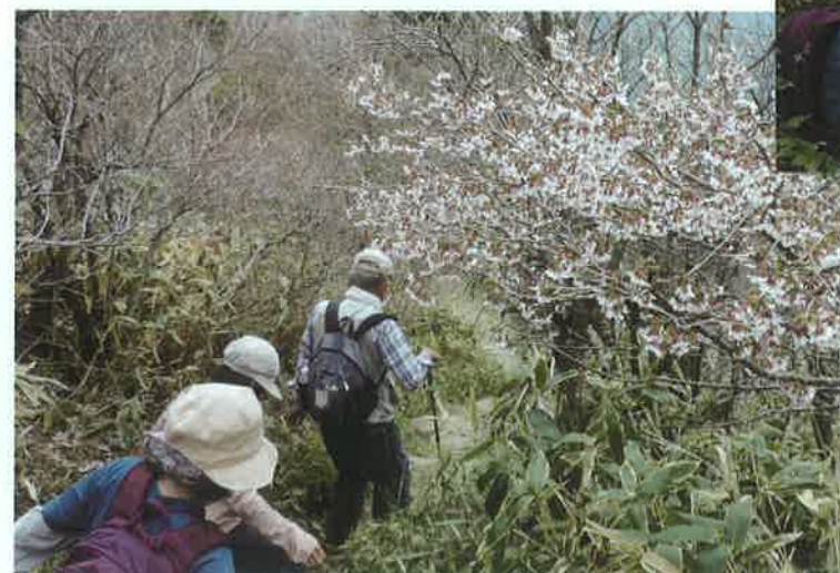
瓶ヶ森「女山」から下山途中！