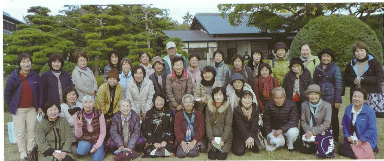
栗林公園内の散策では“若い二人が結婚式の”前撮りをするのを見て、足取りも軽く！楽しく！