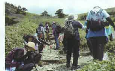
ちょっと休憩し、ゆっくりと空を眺め！新鮮な空気を！