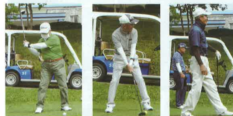
型にはまって“様になっているダロー”