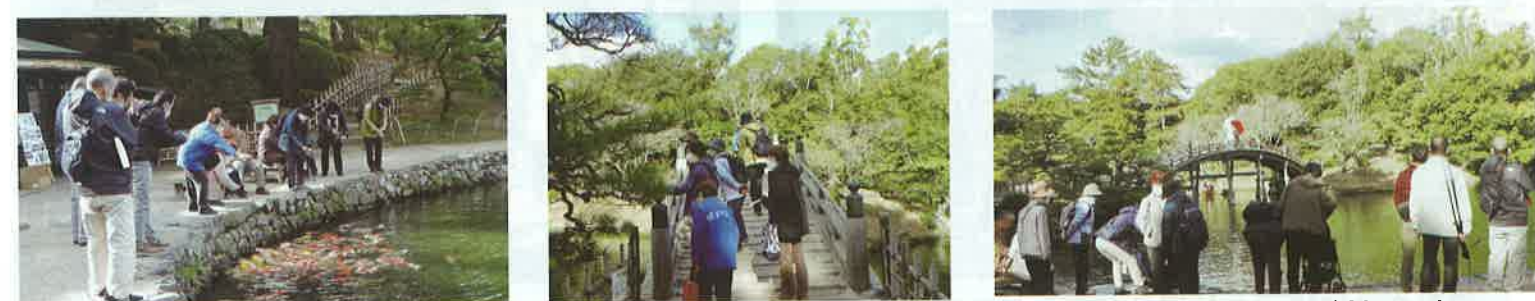
鯉のエサを投げ”楽しむ” 昔を思い出しながら！ 橋の上では、“前撮り中”