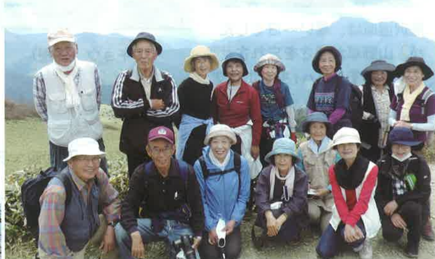
瓶ヶ森山頂まで登った15名の皆さん勢ぞろい