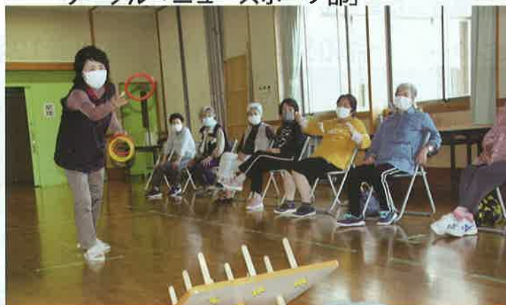
サークル「ニュースポーツ部」