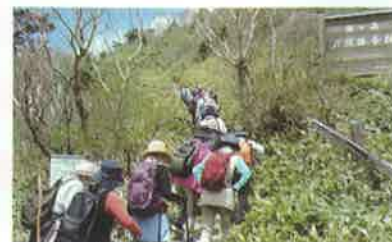
瓶ヶ森への登山口