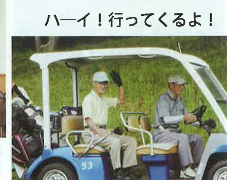
ハイ！行ってくるよ！