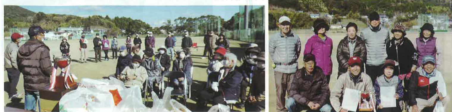
練習の成果を出して今日一日ガンバルゾー・・・開会式に集合した皆さんです。 “入賞”した皆さん