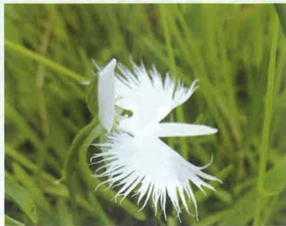
黒沢湿原のサギソウ！