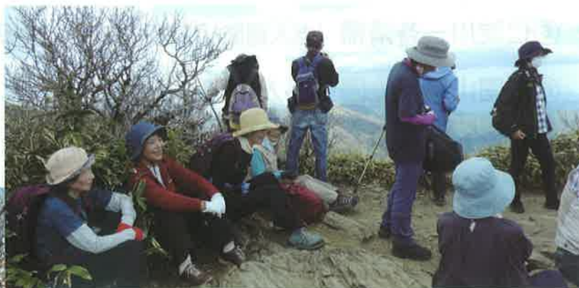
「女山」頂上にて、周囲の山々を眺めながら休憩