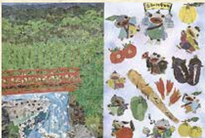
自慢の風景と特産品（安田町）