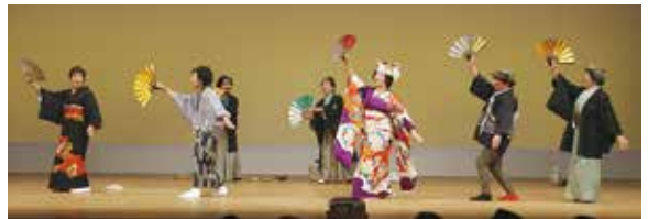
大野見仲よし会（中土佐町）

会場全体が拍手や笑い声に包まれ、参加者全員が一体となり大いに盛り上がった大会となりました。