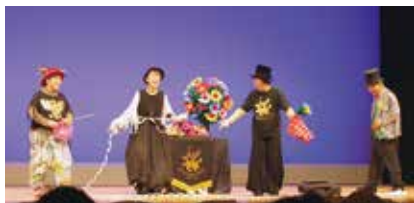
うまじっくクラブ（馬路村）