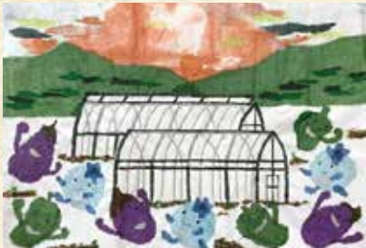
芸西村の風景（芸西村）