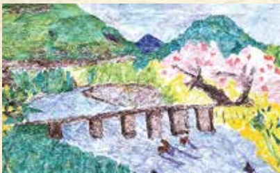
久万秋沈下橋と四万十川にも 春の訪れ（中土佐町）