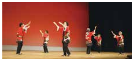
奈半利町民踊 愛好会