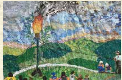
9年ぶりの上分笹野地区の大たいまつ（須崎市）