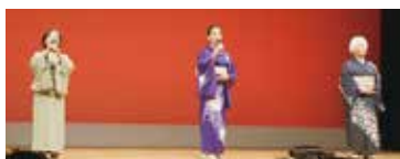
つくしの会（香南市）