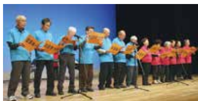
安田はまゆう合唱団（安田町）