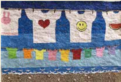
Tシャツアート展（黒潮町）