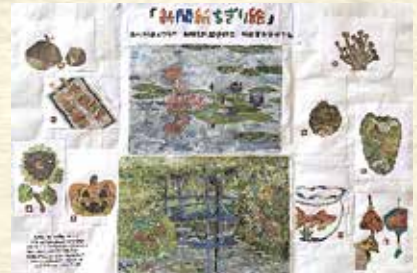
新聞ちぎり絵（北川村）