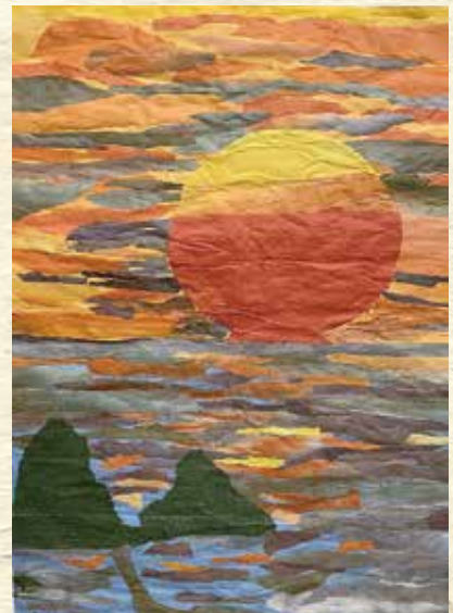
だるま夕日と咸陽島（宿毛市）

このちぎり絵は、会員のみなさんが連帯感を高め、また県老人クラブ大会と「元気ハツラツ&はちきん大会」に彩を添えるために制作したものの一部です。全作品は、本会のホームページで鑑賞することができます。