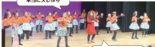
県老連若手委員会&女性委員会