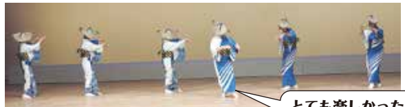
宇佐民踊クラブ（土佐市）