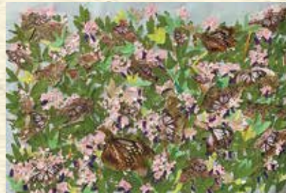
アサギマダラ（香美市）