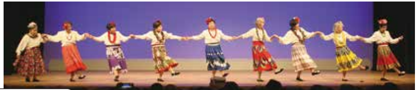
音竹老人クラブ（いの町）