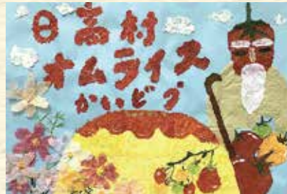
日高村オムライス街道（日高村）