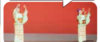
梶原 輪の会（梶原町）