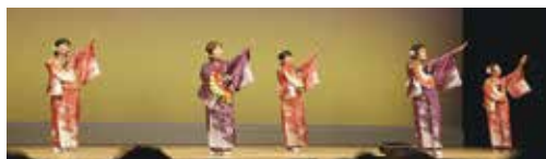
上分清流クラブ 輪の会（須崎市）