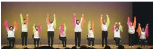
室戸シニアダンサーズ（室戸市）