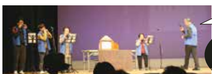
滝山クラブ他（本山町）