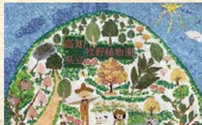
高知県立牧野植物園（高知市）