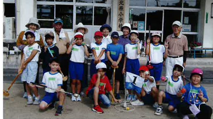
サークル「ニュースポーツ部」