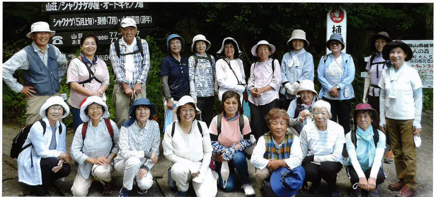
園内をぐるりとガイドさんに案内をしていただき！！