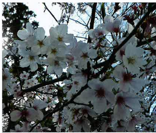
青龍寺へ行く山越えの遍路道に 桜「ソメイヨシノ」が満開