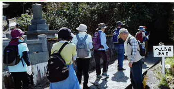
標識もここから“遍路道の入り口”です！