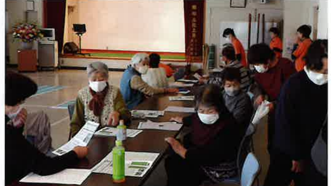
年齢とともに椅子に座る機会が多くなりましたが、健康を保つには30分ごとに立つことも大切！