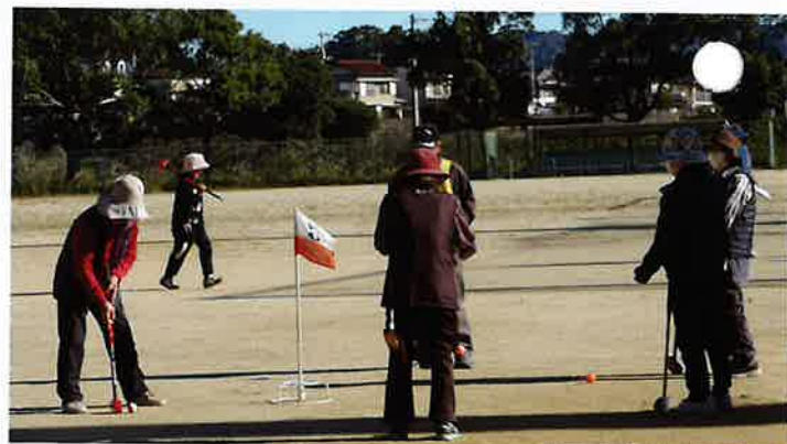
練習の成果が！100%・・・"楽しいね！"