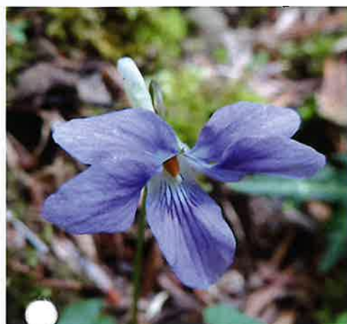
天狗高原 「タチツボスミレ」