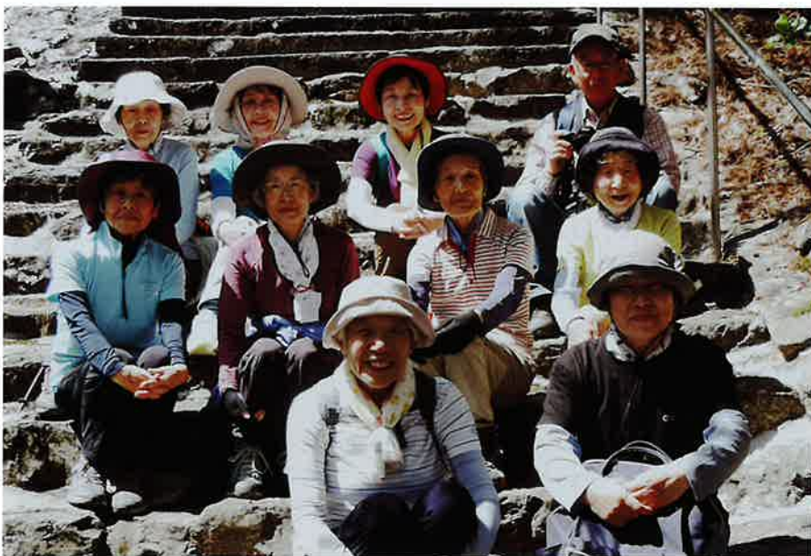
青龍寺を登る階段に腰を下ろして一息を付き！