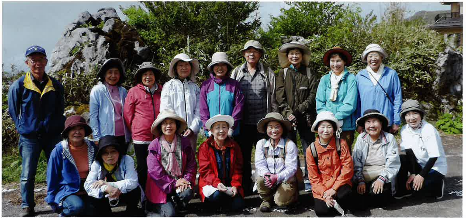
さあ！出発 自由散策コースに参加の皆さん「足の向くまま、気軽にセラピーロードを！」