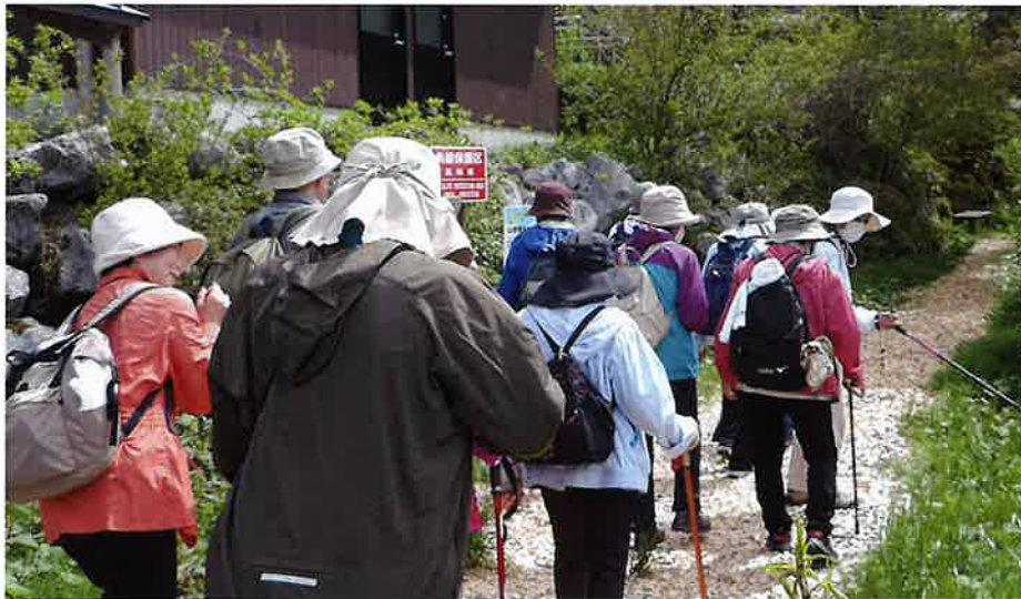
セラピーロード散策コース「ゆっくりと自らの力を信じて！」