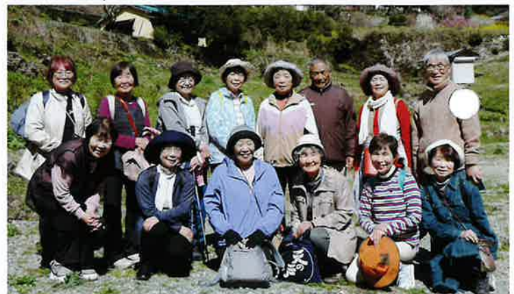
フレンドクラブ蓮池「コミュニティセンターにて」