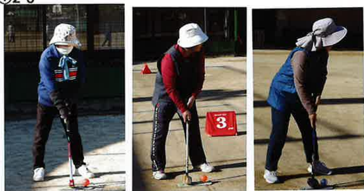
打つ姿勢がプロ級・・・ボールの行方はボールに！