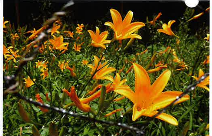
レンゲショウマ (キンポウゲ科) キツネノカミソリ (ヒガンバナ科)