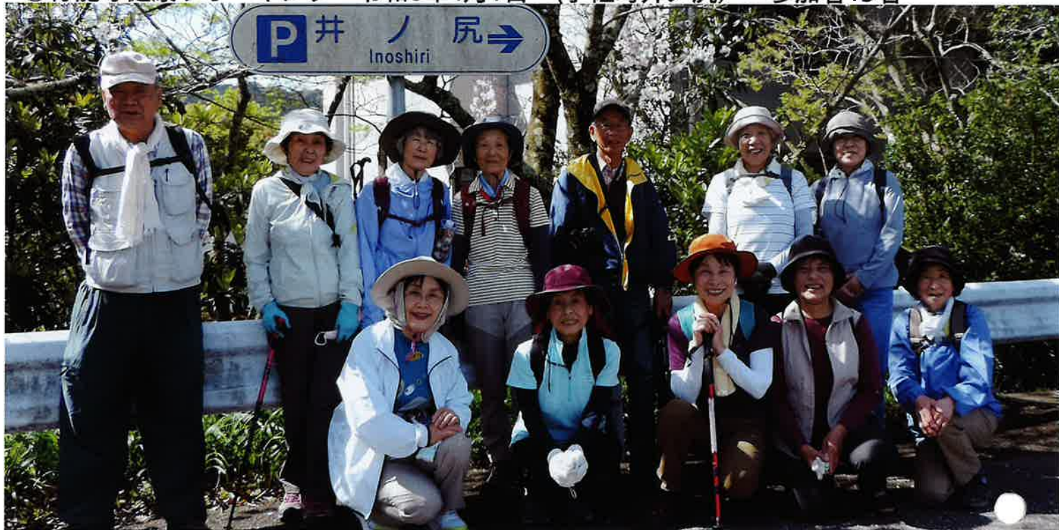
宇佐竜「色見崎駐車場」に集合し、太平洋を眺めながら、井尻峠の遍路道をウォーク！