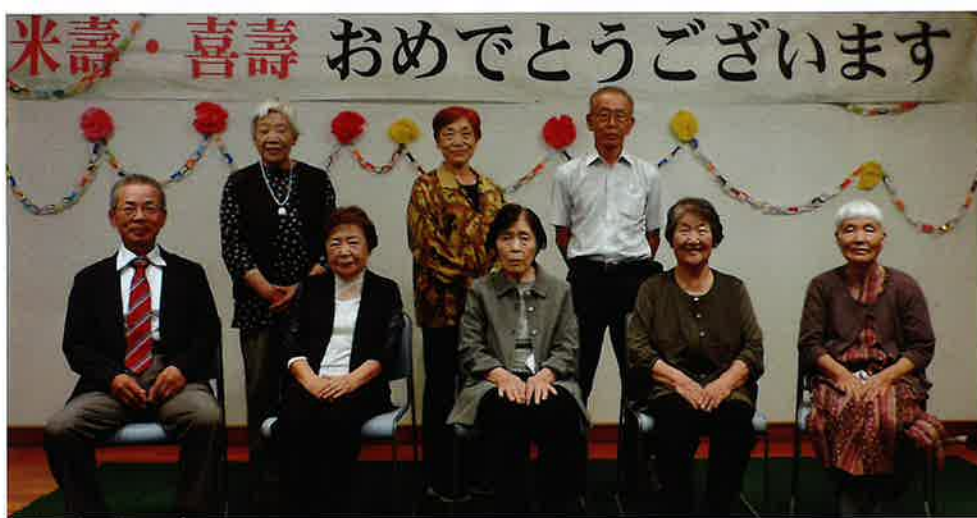
喜寿・米寿を迎えられた皆さん、「健康で何時までも元気で！」