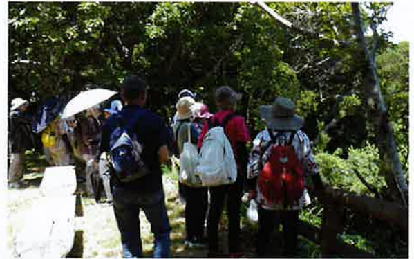
大堂展望台から見る“柏島” グラスボートにて海側から見学予定が・・・海が荒れて「運航中止」に！