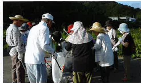
一時間の清掃活動“後はきれいに”