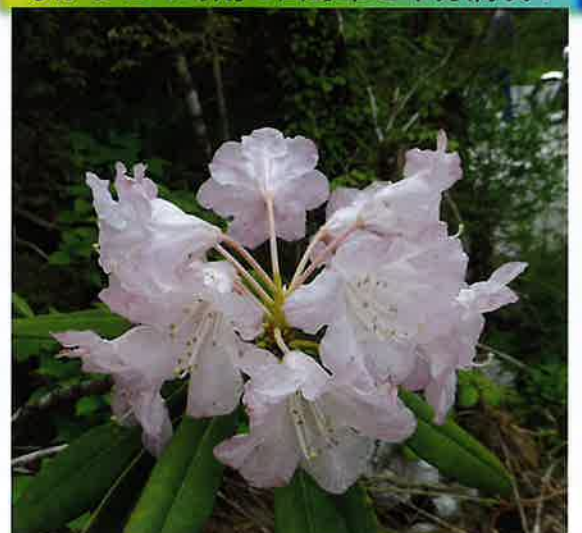
ツツジ科「シャクナゲ」