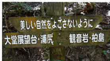
海洋館の入り口付近にて