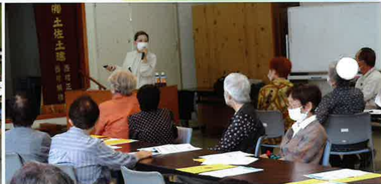
認知症と付き合い方を研修の後、皆さんからカラオケ、踊り、合唱などで歓迎会を！