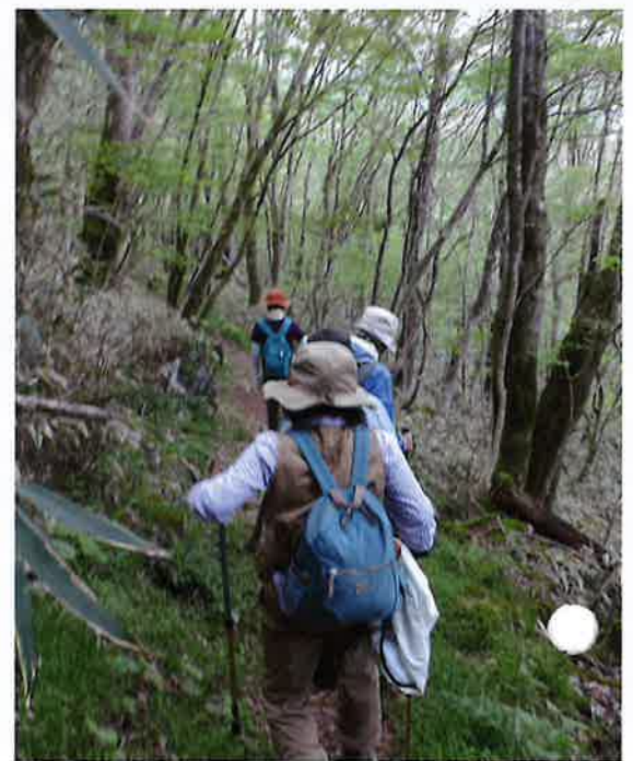
天狗の森コースへ挑んだ皆さん少人数ながらこの時期の山野草を十分満喫！