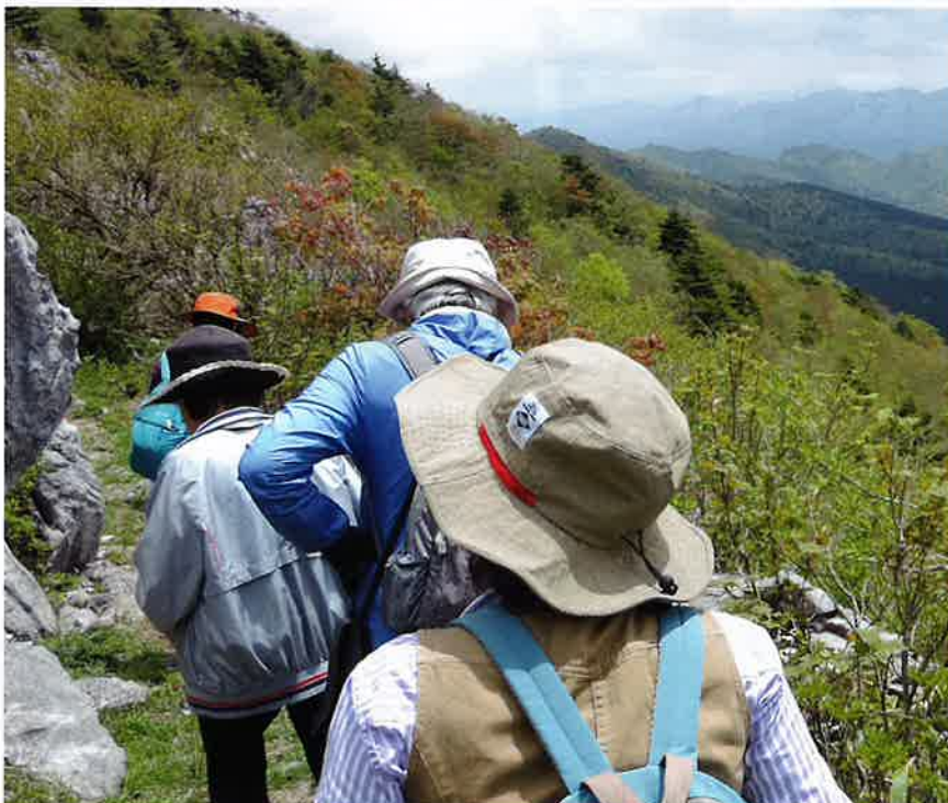
天狗の森への道は、沢山の山野草を楽しみながら！ -4-