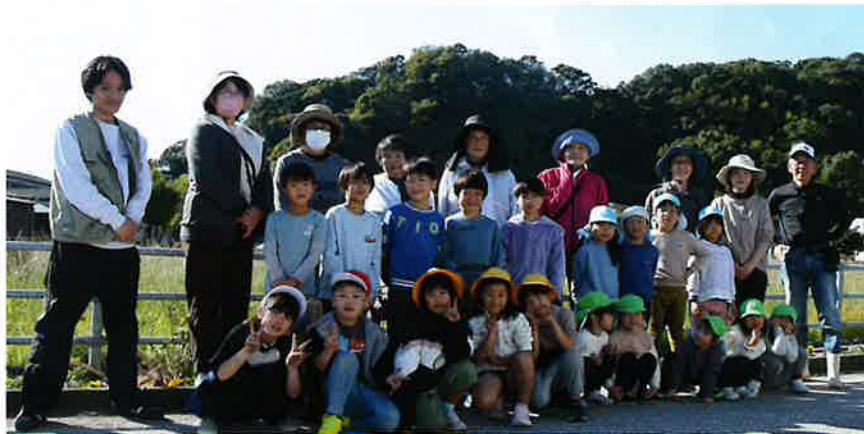
北原白寿会 "子ども達とグラウンドゴルフ競技会"