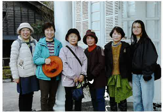
高石地区老人クラブ 大豊町「夢来里」ウオーク