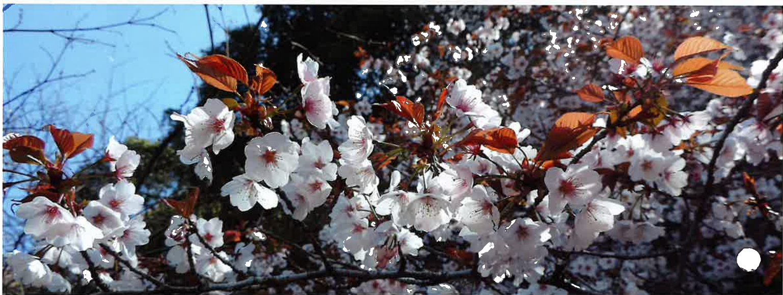
宇佐大橋のたもとでは青龍寺に向かう皆さんを温かく迎えて“桜の花”が満開・・・！