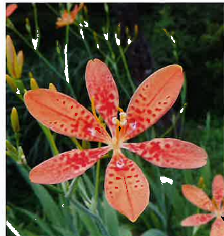
四国山岳植物園「岳人の森」 山野草「ヒオウギ」アヤメ科