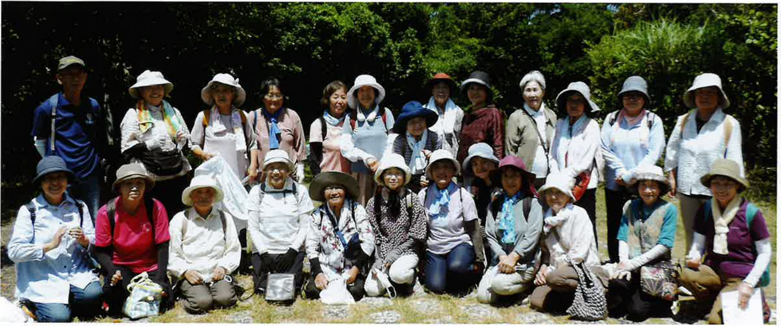
お猿公園から眺める大堂海岸”景観は素晴らしい”お猿さん”に挨拶ができなかったのが、少し残念！